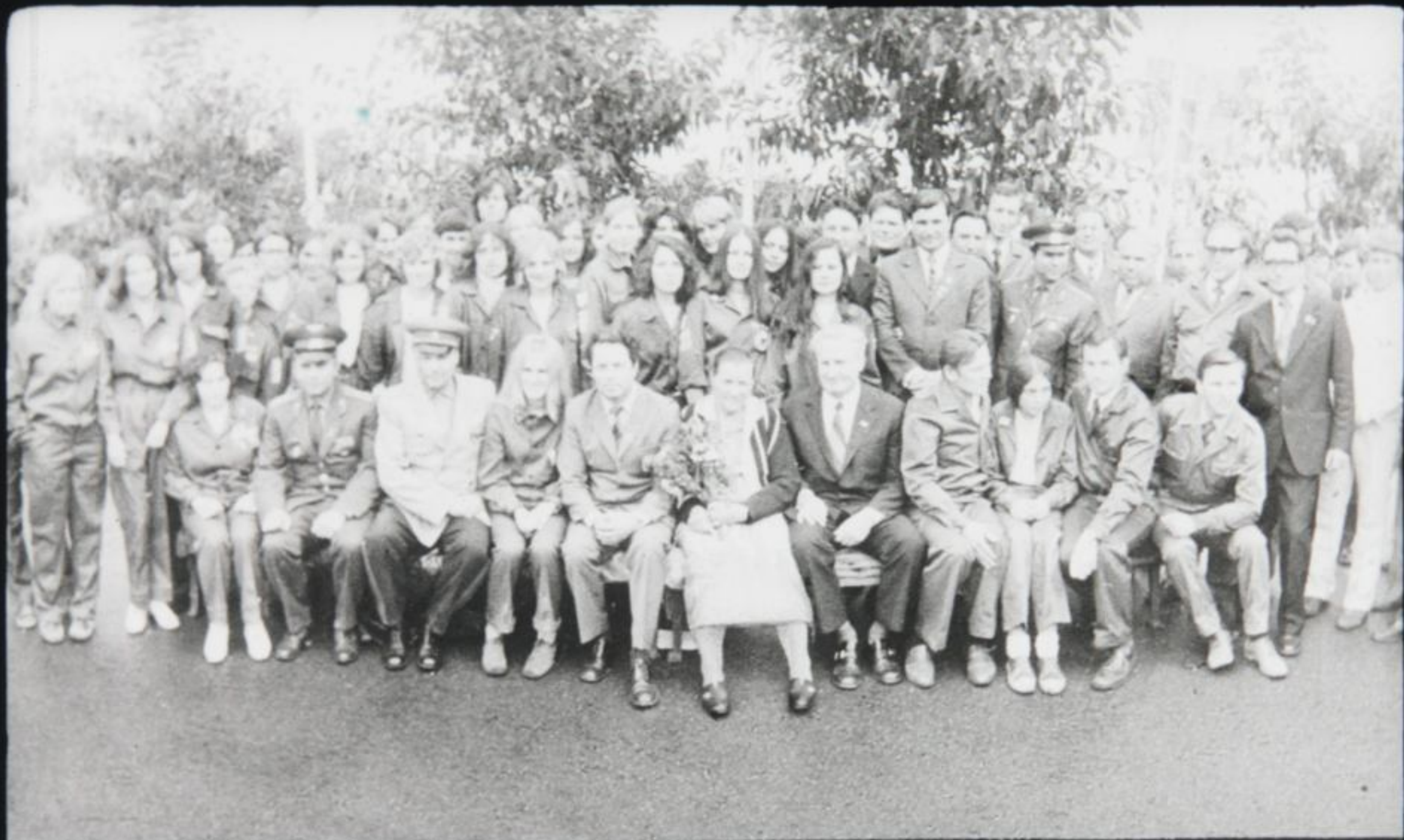
Осень—возвращение домой, фотоснимок на память.