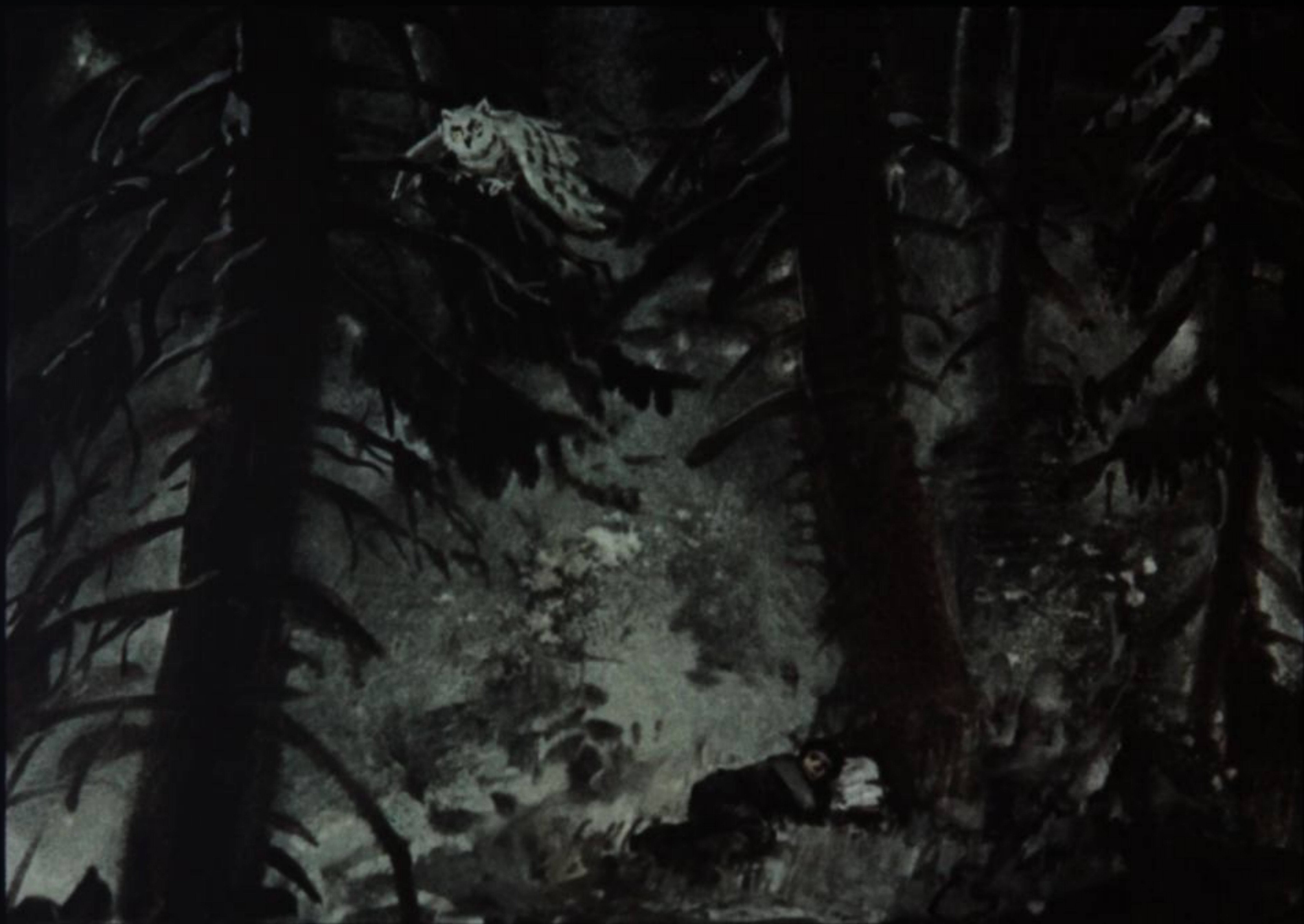
Ночевал мальчуган в лесу — подальше от станций и селений. [18]