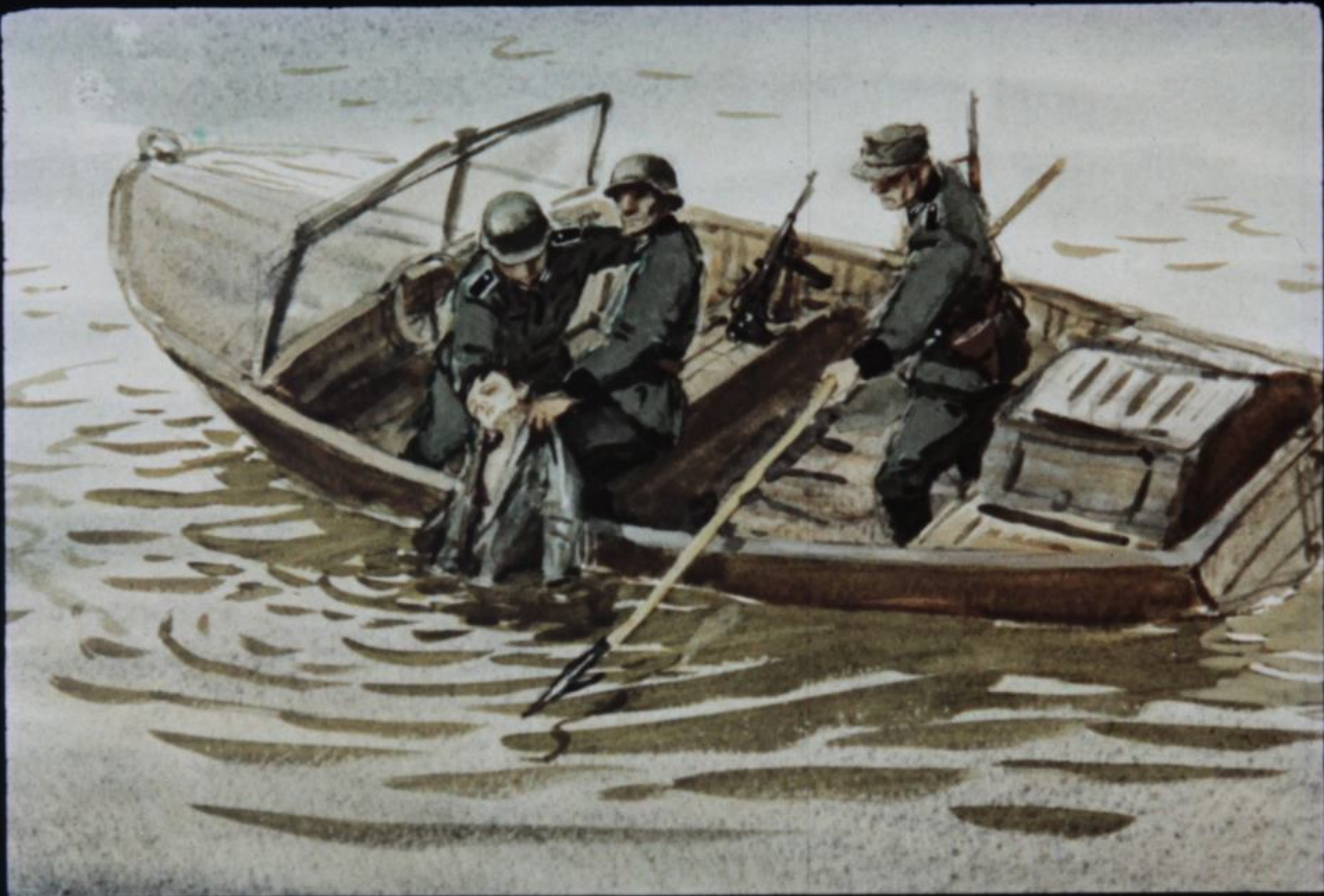
Уцелевшие фашисты спустили с берега катер и вытащили оглушённого взрывом мальчика из воды.