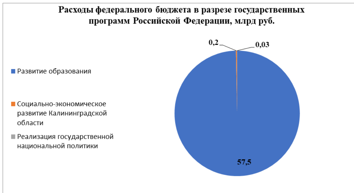
Рисунок 6. Расходы федерального бюджета в разрезе государственных программ Российской Федерации, млрд руб.

В блок расходов по государственным программам входят следующие программы: