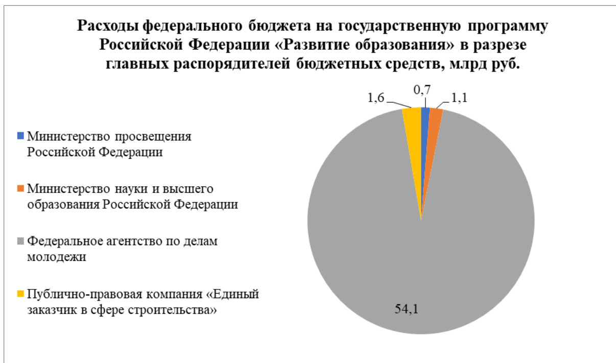
Рисунок 7. Расходы федерального бюджета на государственную программу Российской Федерации «Развитие образования» в разрезе главных распорядителей бюджетных средств, млрд руб.

В рамках государственной программы Российской Федерации «Развитие образования» финансирование молодежной политики осуществлялось в рамках следующих структурных элементов: