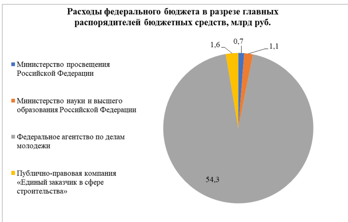
Рисунок 5. Расходы федерального бюджета в разрезе главных распорядителей бюджетных средств, млрд руб.

Самая большая доля федерального бюджета по подразделу 0707 «Молодежная политика» приходится на Федеральное агентство по делам молодежи – 54,3 млрд рублей, что составляет 94,2% бюджета (Рис.5).