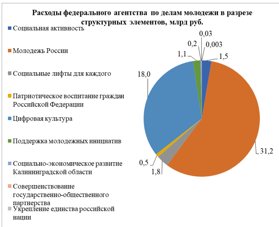
Рисунок 9. Расходы федерального агентства по делам молодежи в разрезе структурных элементов, млрд руб.

Среди нормативных правовых актов о молодежи и молодежной политике в Российской Федерации есть как федеральные законы и иные нормативные правовые акты, так и нормативные правовые акты субъектов Российской Федерации, муниципальные правовые акты.