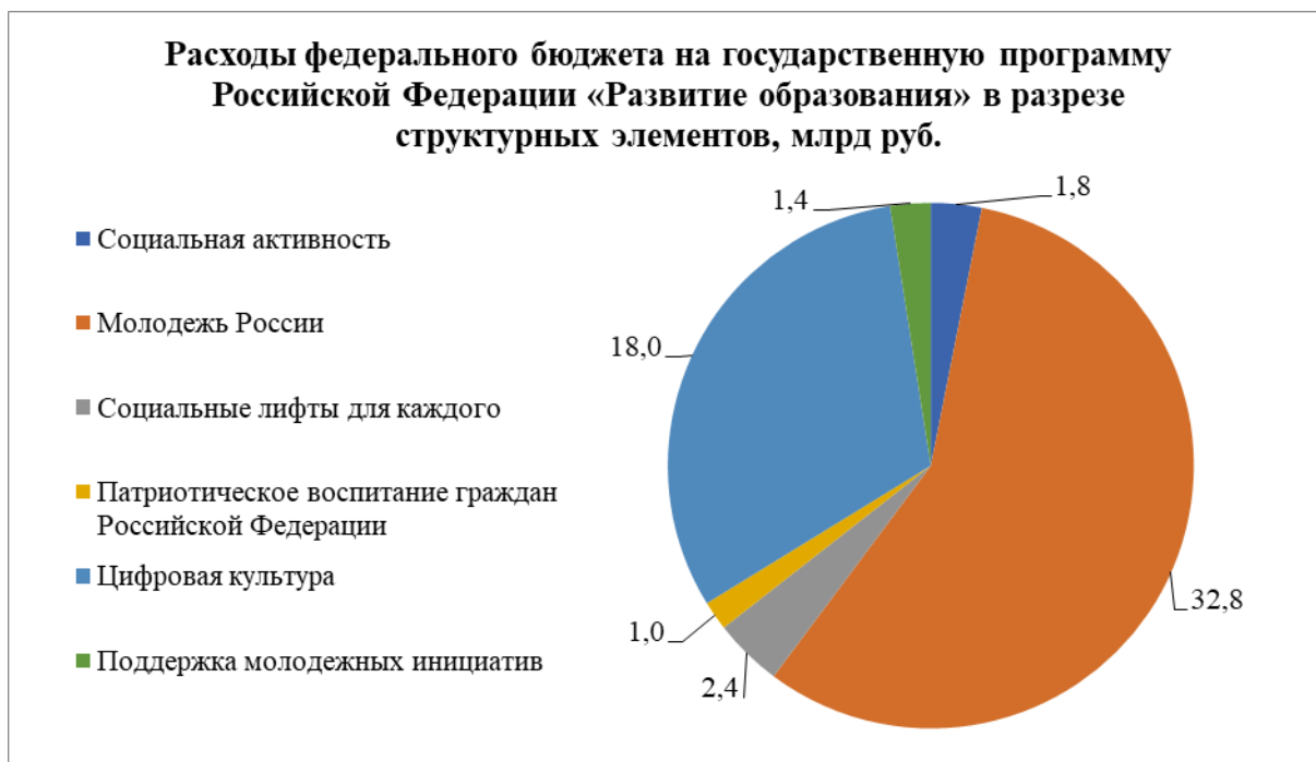
Рисунок 8. Расходы федерального бюджета на государственную программу Российской Федерации «Развитие образования» в разрезе структурных элементов, млрд руб.

В рамках государственной программы Российской Федерации «Социально-экономическое развитие Калининградской области» финансирование молодежной политики осуществлялось только по линии Федерального агентства по делам молодежи в рамках федерального проекта «Социально-экономическое развитие Калининградской области».