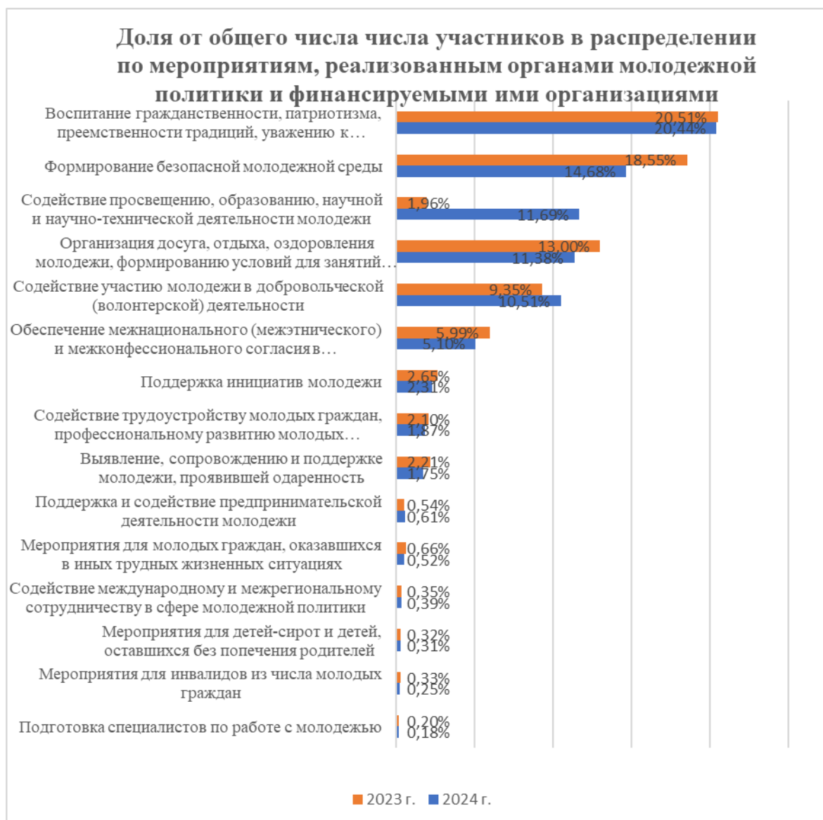
Рисунок 3. Доля от общего числа участников в распределении по мероприятиям, реализованным органами молодежной политики и финансируемыми ими организациями

Также заметным стало увеличение доли мероприятий, направленных на воспитание гражданственности, патриотизма, преемственности традиций, уважению к отечественной истории, историческим, национальным и иным традициям народов Российской Федерации. В 2024 году их доля составила 20% против 16% в 2023 году (Рис.3).