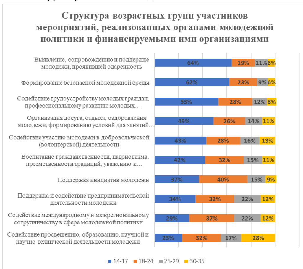
Рисунок 4. Структура возрастных групп участников мероприятий, реализованных органами молодежной политики и финансируемыми ими организациями

Отдельно стоит отметить реализуемую Росмолодежью Всероссийскую премию молодежных достижений «Время молодых» со специальной номинацией «Молодежная столица России», в ходе которой народным голосованием выбирается город, который получает право на статус «Молодежная столица России» на 1 год. В 2024 году обладателями статуса стали г. Владивосток и г. Москва, что позволило городам получить комплексное методическое сопровождение реализации молодежной политики на их территории от Росмолодежи.